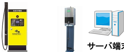
急速充電器 倍速充電器 (通信モジュール内蔵)

経済産業省 平成21年度「低炭素社会に向けた技術シーズ発掘・社会システム実証モデル事業」