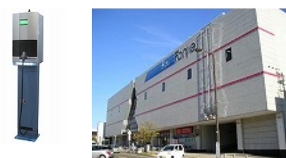
【ショッピングセンター】