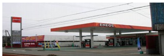
【ガソリンスタンド】